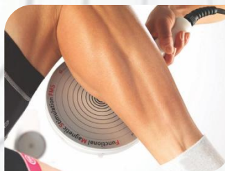
Oslabienie i zanik mięśni